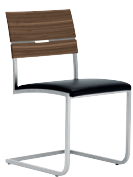
Stuhl 14.1 Freischwinger mit festem Sitzpolster und Holzrücken. Mattnickel