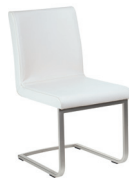
Stuhl 8.1 Freischwinger mit Polsterschale. Glanzchrom oder Mattnickel