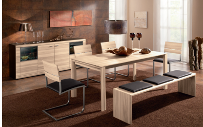
COKE977: COMO in Kernesche matt, Beintisch 180 x 90 cm, gerade Bank 180 cm, Bezug Leder 977. Freischwinger 14.1. Sidebord 4-teilig (Korpus Kernesche schoko).