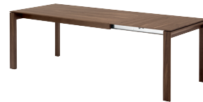
Tisch mit Einlegeplatten (2 Einlegeplatten à 40 cm) 180 (260) x 90 cm, H 76 cm 160 (240) x 90 cm, H 76 cm