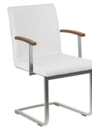
Armlehnstuhl 8.2 Freischwinger mit Polsterschale. Glanzchrom oder Mattnickel