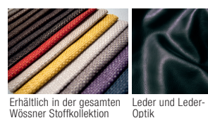
Erhältlich in der gesamten Wössner Stoffkollektion Leder und Leder-Optik