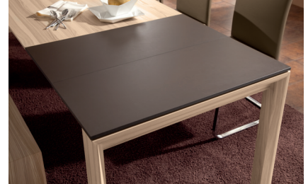
Tischverlängerung in Lack schoko.