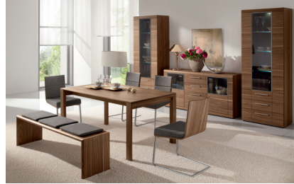
CONB452A: COMO in Nussbaum matt, Beintisch 160 x 90 cm, gerade Bank 160 cm, Bezug 452. Freischwinger 10.1. Vitrine (links und rechts) 1-teilig, Sidebord 3-teilig.