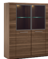
Highbord 2-teilig 131/154/43 cm