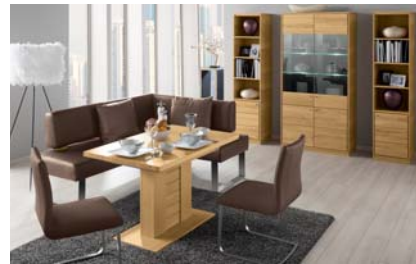
PCAE995B: Seitenwange 4, Eckbank 193 x 153 cm, Bezug Leder 995, Freischwinger mit Polsterschale, Säulentisch mit Auszug in Asteiche natur 120 (165) x 80 cm