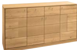
Applikation Holz geschruppt

Sideboard 4-teilig mit Applikation wahlweise Holz geschruppt, Stone Veneer oder Spaltholz. B/H/T: 163/86/42 cm