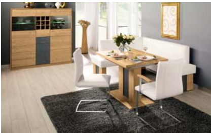
PCAE293B: Seitenwange 3, Eckbank 193 x 153 cm, Bezug Leder-Optik 293, Freischwinger mit Polsterschale, Säulentisch mit Auszug in Asteiche natur 120 (165) x 80 cm