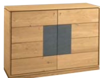
Applikation Stone Veneer

Sideboard 2-türig mit Applikation wahlweise Stone Veneer, Holz geschruppt oder Spaltholz. B/H/T: 123/86/42 cm