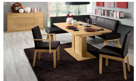
CTAE997: Seitenwange 2 in Asteiche natur, Eckbank 242 x 172 cm, Bezug Leder 997, Säulentisch 165 x 95 cm, Applikation Holz geschruppt.