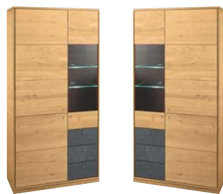
Applikation Stone Veneer

Vitrine 2-teilig mit Applikation wahlweise Stone Veneer, Holz geschruppt oder Spaltholz (rechts oder links). B/H/T: 160/201/42 cm