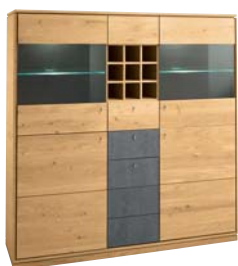
Applikation Stone Veneer

Bigboard 3-teilig mit Applikation wahlweise Stone Veneer, Holz geschruppt oder Spaltholz. B/H/T: 160/163/42 cm