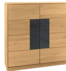
Applikation Stone Veneer

Highboard 2-türig mit Applikation wahlweise Holz geschruppt, Stone Veneer oder Spaltholz. B/H/T: 123/125/42 cm