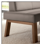
Wange 2 Bügelfuß aus Holz