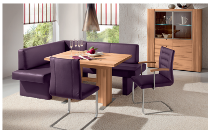
GNKB295B: GENUA Seitenwange 1, Eckbank 193 x 153 cm, Bezug 295 Leder-Optik, Freischwinger Polsterschale mit und ohne Armlehnen. Wangentisch mit Auszug 140 (185) x 80 cm. Korpusmöbel aus LUGANO.