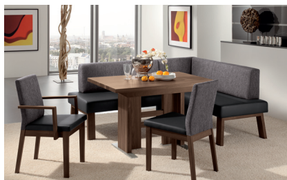
GNNB298_279: Nussbaum, Seitenwange 2, Eckbank 193 x 153 cm, Bezug Sitz 298 Leder-Optik, Rücken 279, 4-Beinstuhl mit und ohne Armlehnen. Säulentisch 140 (185) x 80 cm.