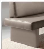
Wange 1 Polsterwange