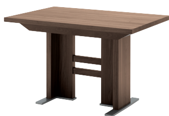
Wagentisch mit fester Platte und mit Ansteckplatte 140 (185) x 80 cm 120 (165) x 80 cm