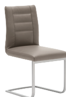
Freischwinger mit Polsterschale, Mattnickel oder Glanzchrom