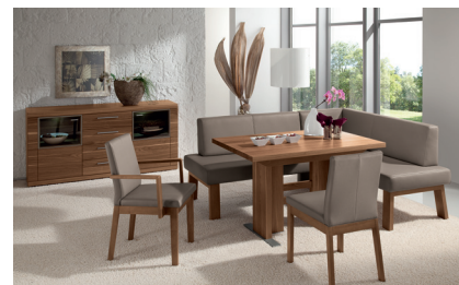
GNNB296B: GENUA Seitenwange 2 in Nussbaum matt, Eckbank 193 x 153 cm, Bezug 296 Leder-Optik, 4-Beinstuhl mit und ohne Armlehnen. Säulentisch 140 (185) x 80 cm. Korpusmöbel aus COMO.