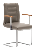
Freischwinger mit Polsterschale, mit Armlehnen Mattnickel oder Glanzchrom