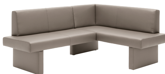
Eckbank mit Polsterwange (Schenkellängen links oder rechts) 153 cm 193 cm 213 cm