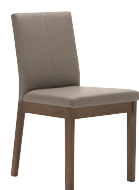
4-Beinstuhl mit festem Sitz- und Rückenpolster