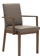
4-Beinstuhl mit Armlehnen mit festem Sitz- und Rückenpolster