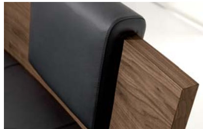
Aufsteckbare Rückenpolster lassen sich am Holzrücken frei platzieren.