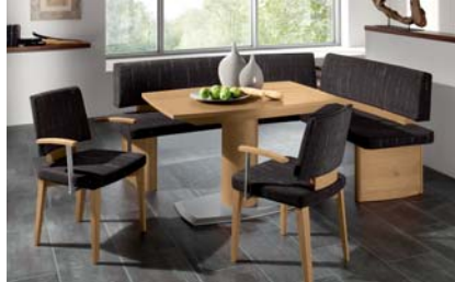
MLWE383: MALAGA mit Polsterrücken. Wildeiche matt. Bezug 383. Eckbank Schenkelmaße: 206 x 161 cm. Säulentisch: 120 (165) x 80 cm.