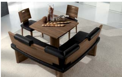
Frei in den Raum platzierbar.