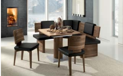
MLNB790: MALAGA mit Holzrücken. Nussbaum matt. Bezug 790 Lederoptik. Eckbank Schenkelmaße: 158 x 158 cm. Säulentisch: 90 x 90 cm.