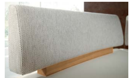
Alternativ: Der feste Polsterrücken.