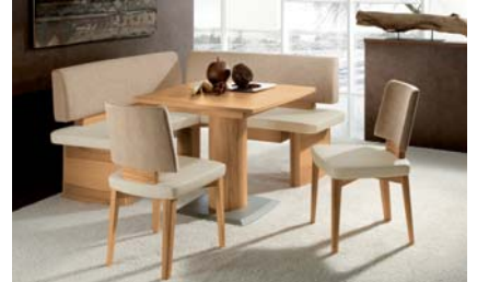
MLKB788_727: MALAGA mit Polsterrücken. Kernbuche matt. Bezug Sitz 788 Lederoptik/ Rücken 727 Stoff. Eckbank Schenkelmaße: 158 x 158 cm. Säulentisch: 90 x 90 cm.