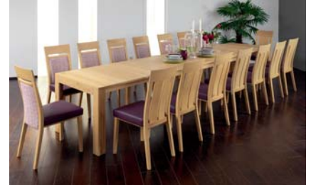
Kulissen-Haubentisch mit max. 4 Einlegeplatten Längenmaße: 200 - 416 cm möglich