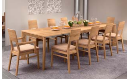
4-Beintisch mit Gestellauszug und 2 Klappeneinlagen Längenmaße: 160 - 320 cm möglich