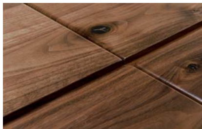
Über die Ansteckplatten wird das Tischmaß verlängert.