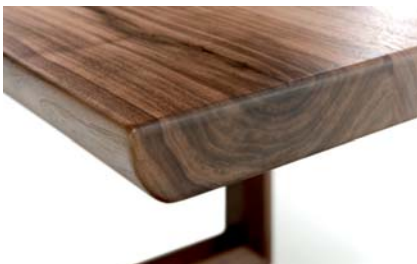
Massivholztisch in der natürlichen Form eines Baumes (Baumkanten).