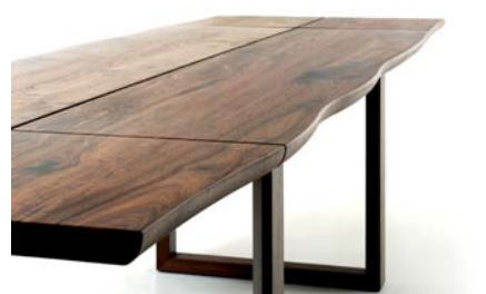
Das Maßerungsbild läuft durch.