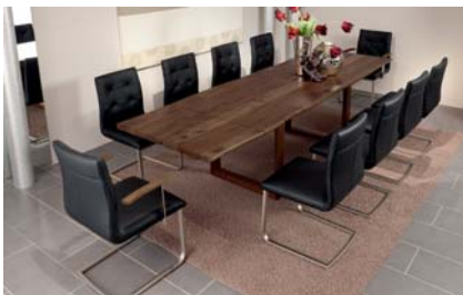
Der Wagentisch mit Wellenform/Baumkante. Längenmaße: 160 - 320 cm möglich