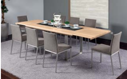
Wagentisch mit Vor-Kopf-Auszug und je einer Klappeneinlage links/rechts Längenmaße: 160 - 320 cm möglich